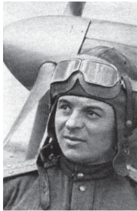
А.Т. Карпов, самый результативный ас войск ПВО