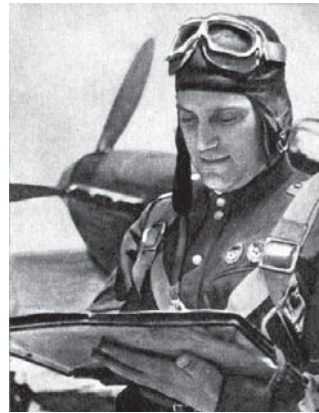
С.Я. Савицкий, дважды Герой Советского Союза, маршал авиации